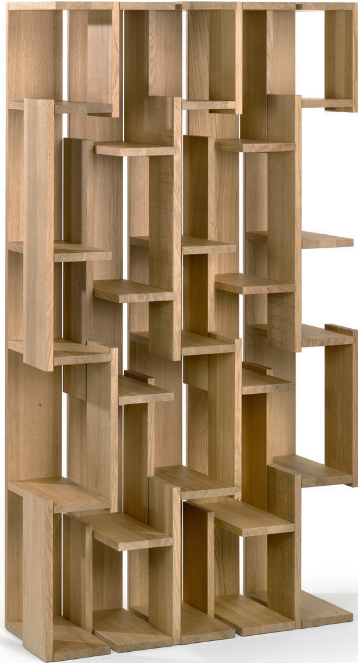
Staccato Atelier Oi