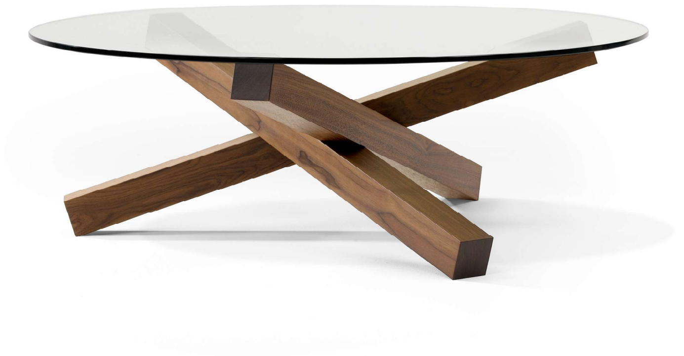
Campfire Tomek Archer 2009